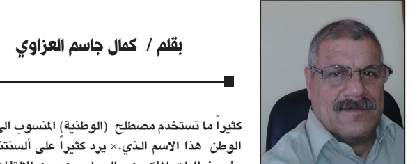
بقلم / كمال جاسم العزاوي