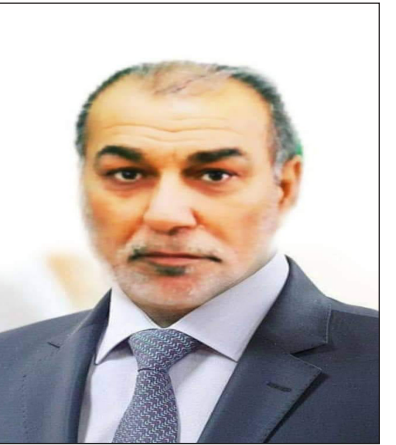
عيناك اجمل قصيدة.. عجزت الشعراء عن تدوينها عجزت اقلامهم عن الخوض