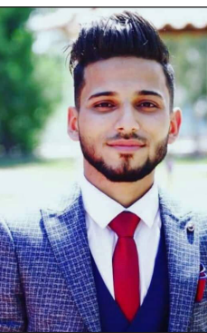
بقلم : غيث الشمري أذابت وجهك السنين ولم تزل ابتسامه تغرك الوضاء ترسم ملامحك بشغف يا دوحة أرتمي في أحضانها كل حين يا نبراساً تثير لنا ظلمات السنين

يا من أتعبته الأنات والأحزان يا منبع الأمل يا سندي إليك أبتُ صبوتي وحنيني تعدى عمرك الخمسين يا أبت مضت بالاشواق تعب اليبدين ضلوع صدرك لأجلنا نيران القلب تلتهب إذا أصابنا يوماً داء ينتخب تواري عبرة حرى