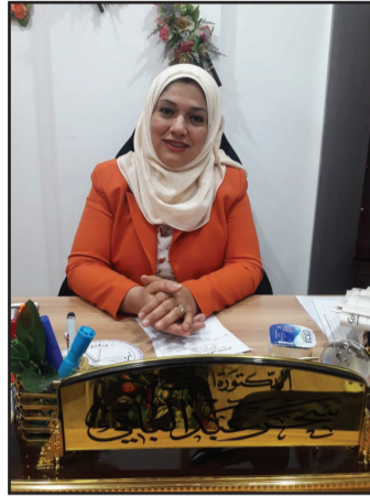
الخالية من التشوهات الخلقية ... تأخر الحمل باتت مشكلة بالوقت الحالي واسبابها كثيرة قد تكون من الزوجة او الزوج وللمعرفة الاسباب ضروري مراجعة الزوجين للطبيبة المتخصصة لتجنب التعقيدات والتي تحتاج بعدها لعلاجات اكثر ولكل

الخدمات المقدمة في عيادتها كان لجزيرتنا زيارة الى عيادتها والالتقاء بها حيث كان لنا معها هذا الحوار :- بدأ هل لك ان تعرفي القراء الكرام عن اختصاصك وعملك واهم التقنيات المستخدمة في عيادتك ؟ انا طبيبة اختصاصية بالجراحة النسائية والتوليد والعقم دكتورا بورد عربي وعراقي زميلة المجلس العراقي والمجلس العربي للاختصاصات الطبية وعضو في جمعية الخصوبة العراقية