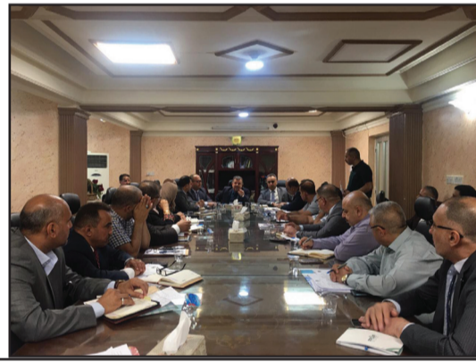
اجتماع إدارة الشركة العامة لتجارة الحبوب مع مدراء الفروع الشلية.

تسويق الشلب والتي تهدف الى تعزيز ثقة الفلاح بالذوله من خلال تدليل كافة العوقات التي قد تصادفه " ولابد لنا ان نبدء من الان بتأمين مستلزمات النجاح من خلال هذا اللقاء نريد ان نستمع منكم ماذا تحتاجون و كيف السبيل لتجاوز اي اشكالات فنية او ادارية ، ماهي البديل التي يمكن ان تكون متممه للنجاح . واستعرض مدراء الفروع الشلية عدد من العوقات التي ستواجههم