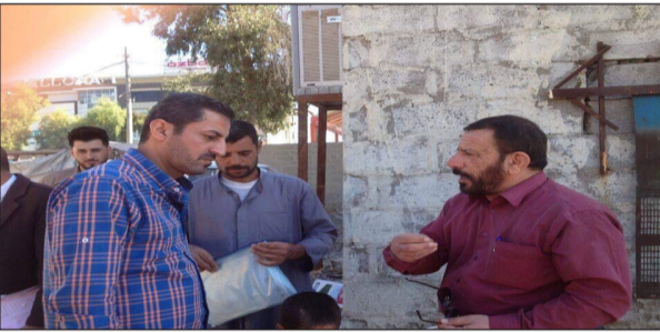
العراق الاخبارية / علي ابراهيم حسن