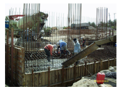
بطول ٢٤ متر للقضاء الواحد .. تم صب عددا من الدعامات والإعمدة

والجسور العرضية مع الكتف جهة الحلانبة وتنفيذ جدران القواعد لعدد من الأعمدة وصب روافد عدد ٨ وتهيئة قواعد صب الروافد من جهة بروانة .. كما يتم العمل باللسان الترابي بلغت نسبة انجاز المشروع ١٣,٩٨٥٪..وينفذ بكلفة ١٣,٩٨٥ مليار دينار وبإشراف الكادر الهندسي في مديرية طرق الانبار ..