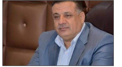
العراق الاخبارية علي الصوفي

وجه محافظ ديالى، فثنى التعميم مديرية تربية ديالى بإصدار أوامر إدارية لعموم المحاضرين المجانيين، ونكرت نقابة المعلمين في ديالى ان محافظ ديالى مثنى التعميم وجه المديرية العامة لتربية ديالى بإصدار أوامر ادارية لجميع المتقدمين بصفة محاضر مجاني. وأضافت ان الأوامر ستشمل جميع المحاضرين وفي عموم مناطق المحافظة.