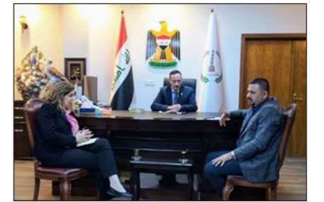
العراق الاخبارية علي ابراهيم حسن

ناقش محافظ نينوى نجم الجبوري ملف النازحين مع ممثلين من منظمة الـ UNDP ولجنة سلام الموصل التطوعية خلال استقباله لهم في ديوان المحافظة، وأشار الجبوري الى ان ملف النازحين من الملفات التي اولى لها اهتماماً كبيراً من خلال العمل مع المؤسسات الحكومية والمنظمات المحلية والدولية لتوفير الظروف الملائمة لعودة النازحين الى مناطقهم وانهاء معاناتهم بالسرعة الممكنة.