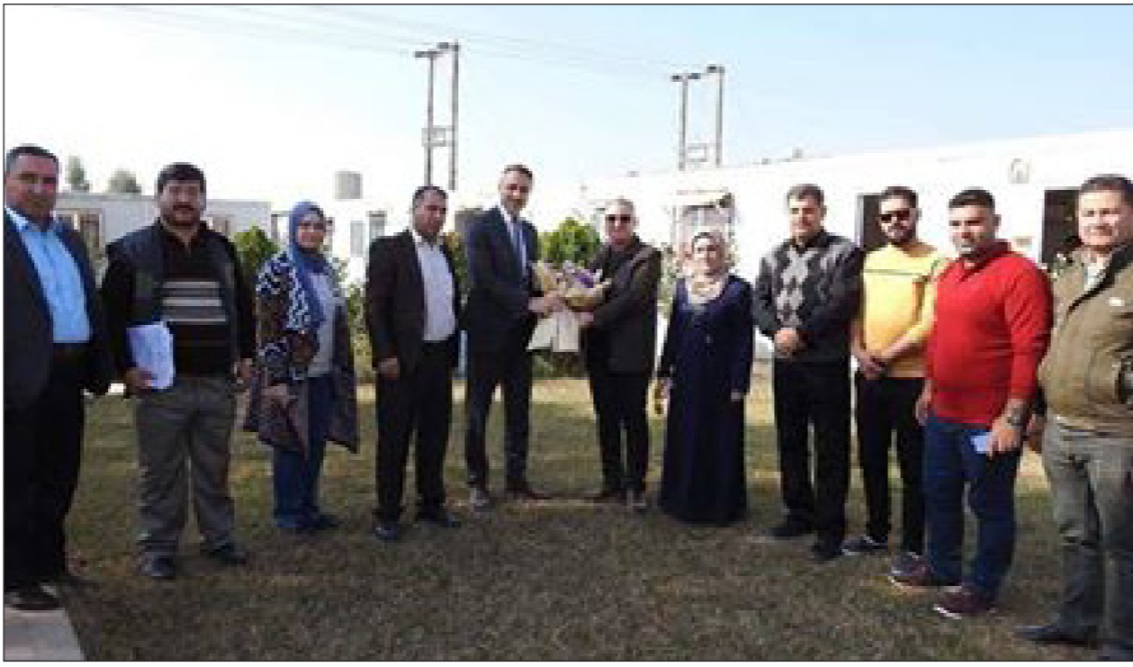
العراق الاخبارية علي شحونة الكعبي

زار مدير عام الماء المهندس (نجم سعيد محمد) مديرية ماء كركوك وكان في استقباله مدير ماء المحافظة والمعاون الفني وكادر دائرة المهندس المقيم للمشروع للاطلاع على سير الاعمال المنفذة من قبل شركة الفاو الهندسية وبإشراف دائرة المهندس المقيم للمشروع. حيث بلغت نسبة الانجاز للمشروع ٩٠,٥ ٪ بطاقة ١٢٠٠٠م٣/ساعة ويضم ١٢ حوض ترسيب و ٦٠ فلتر للتصفية الى جانب ابنية ومنشآت فنية . وأشار خلال تجوالهم في المشروع الى ضرورة انجاز المشروع بفترة قياسية كون المرحلة الاولى للمشروع تعود للعام ١٩٩٣، ثم اطالع المهندس نجم سعيد على الجزء المنجز من الخط الناقل واعمال الربط وعلى المسار المقترح حتى الخزان رقم (٢) الواقع في منطقة رحيم اوه وقد اشاد المدير العام بالجهود المبذولة من قبل العاملين على المشروع من مديرية ماء كركوك وشركة الفاو وبذل المزيد للاسراع في انجاز المشروع بأسرع وقت خدمة لاهالي مدينة كركوك.