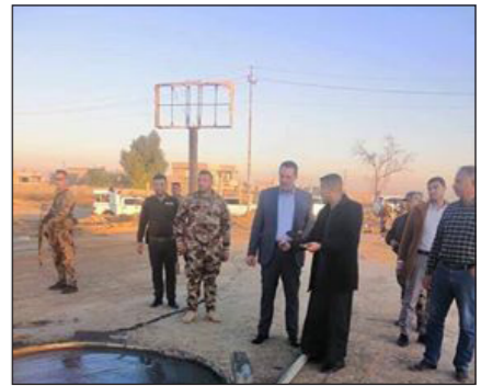
العراق الاخبارية علي ابراهيم حسن

تابع محافظ كركوك سير تنفيذ المشاريع الخدمية في قضاء الحويجة ضمن جهود إدارة المحافظة وصندوق إعادة اعمار المناطق المتضررة من العمليات الإرهابية. وقام الجبوري بزيارة لمشروع مدخل قضاء الحويجة الذي يجري تنفيذه، الى جانب زيارته لمشاريع تأهيل الأحياء السكنية. وتضمن أهالي القضاء جهود محافظ كركوك وفريق التخطيط العام والدوائر الساندة وإدارة الحويجة لما يقومون به من أعمال خدمة لمواطني القضاء ودعمًا لجهود إعادة الاستقرار. ودعا المحافظ لضرورة الالتزام بالتوقيتات الزمنية والضوابط المعتمدة، بما يضمن جوده العمل وعدم التهاون تجاه أي خلل فني أثناء التنفيذ للأعمال.