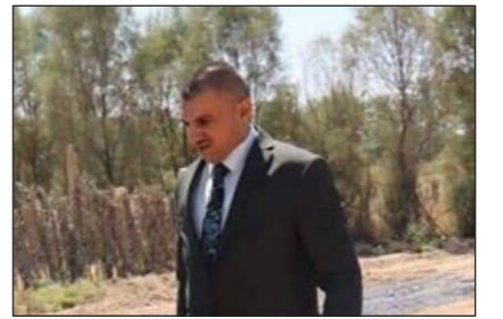
العراق الاخبارية علي الصوفي

بعد معاناة طويلة لأهالي منطقة المفرق من سوء شارع المدخل المعروف بالشارع العريض تم يوم أمس وبمناخية وإشراف مباشر من قبل نائب محافظ ديالى الفني الأستاذ محمد قتيبة البياتي مباشرة بتأهيل وإكساء شارع المدخل لمنطقة المفرق في بعقوبة خدمة أهالي المنطقة.