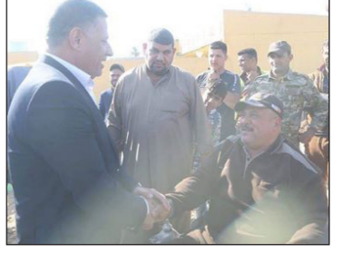
العراق الاخبارية علي الصوفي

زار محافظ ديالى مختى التميمي ناحية خان بني سعد والتقى التميمي بوجهاء واهالي الناحية واستمع الى المعوقات والمشاكل التي يعانين منها، وتوقف منطقتي الرسول وحي الربيع ميدانيا للاطلاع على متطلبات الاهالي وتابع اهم الاحتياجات موجها الجهات المعنية العمل على تذليلها بالسرعة الممكنة، مؤكدا للاهلي حرص ادارة المحافظة على تذليل العقبات التي تواجه ملف الخدمات .