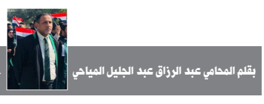
بقلم المحامي عبد الرزاق عبد الجليل المياحي

ليس له مقابل وفاء كاف قائم وقابل للتصرف فيه أو أسترد بعد إعطائه أيام كل المقابل بقيمة أو أمر المسحوب عليه بعدم الدفع أو كان قد تعمد تحريره أو توقيعه بصورة تمنع من صرفه. ٢- ويعاقب بالعبودية ذاتها من ظهر لغريم (صكا) (شيكاً) أو سلمه صكاً مستحق الدفع لحامله وهو يعلم أن ليس له مقابل في كل مبلغه. ( ونرى بأن العقوبة أصبحت لاتتناسب مع الظروف الاقتصادية والتعاملات التجارية المتزايدة وبمبالغ