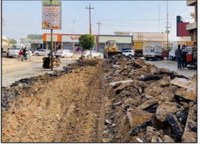
بلدية الرمادي : المباشرة بأعمال