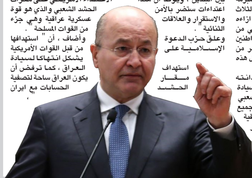
استهداف مفار الحشد

الشعبي ، مؤكداً رفضه جعل العراق ساحة تصفية حسابات مع إيران . وقال الحزب في بيان ، ندين الاعتداء الاميركي على مفارات الحشد الشعبي والذي هو قوة عسكرية عراقية وهي جزء من القوات المسلحة . وأضاف ، ان استهدافها من قبل القوات الاميركية يشكل انتهاكاً لسيادة العراق ، كما ترفض أن يكون العراق ساحة لتصفية الحسابات مع إيران