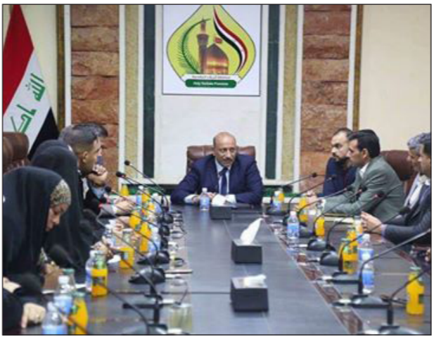
العراق الاخبارية حسن الطويل

ضمن التواصل مع رؤساء الاقسام والموظفين في الادارة المحلية في المحافظة التقى محافظ كربلاء المقدسة نصيف جاسم الخطابي بقسم الاعلام والاتصال الحكومي في الادارة المحلية في المحافظة وجاء اللقاء لمناقشة سبل تطوير هذا القسم والارتقاء به حيث أكد المحافظ على اهمية دور الاعلام ومساهمة الفاعلة في تشخيص وتسليط الضوء على مشاكل واحتياجات المواطنين من خلال وسائل الاعلام المسموعة المتمثلة بأذاعة المحافظة وموقع المحافظة التي ستطلق قريبا خدمة شكاوى المواطنين فضلا عن تسليط الضوء على حملة البناء والاعمار التي تشهدها المحافظة، مؤكدا