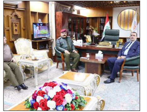
العراق الخبرية على ابراهيم حسن

بحث محافظ كركوك راكان سعيد الجبوري رئيس اللجنة الأمنية العليا، وقائد المقر المتقدم للعمليات المشتركة الفريق ركن قوات خاصة سعد حريه، اوضاع المحافظة وجهود القوات الأمنية في ملاحقة فلول داعش، وتعزيز الأمن والاستقرار وتفعيل الجهد الاستخباري. جاء ذلك خلال لقاء عقد بمبنى المحافظة وحضره قائد شرطة محافظة كركوك، ومدير الأمن الوطني ومدير المرور.. وشارك محافظ كركوك بدور قيادة المقر المتقدم وجميع التشكيلات الأمنية في حفظ الأمن والتعاون مع مواطني كركوك ودعم جهود الإدارة ودوائرها في انجاز المشاريع وخدمة مواطني كركوك كأولوية في عملنا المشترك.