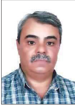
بقلم / أحمد المرواني

آخر وهو إحدى ساحات الاعتصام الشبابي اما في الحويبي او في التحرير وامام المألكة حتى يكون الجمع الجماهيري شاهدا على منطوق القسم الذي يبدأ بأسم الله العظيم ثم بالعراق ثم بدماء الشهداء التي سالت على ارض العراق وهي تدافع عن التغيير ويكون القسم ملزم للمرشح على ان يؤدي واجبه بكل ما يملك من وطنية عراقية خالصة ويبعده عن الحزب والمبول لأي جهة عدا العراق وجمهور العراق كي ينبي عراق المؤسسات والبعيد عن المحاصصة واختيار الوزير المناسب لوزارته والمدير العام لادارته والضابط والجندي والموظف الذي يكون ولائهم الاول والاخير للعراق ولا يعملون باجندة خارجية بل اجندة عراقية صرفة تجعل منهم اناس يعيرون ويموتون على حب العراق واهل العراق. فنصحة القسم ستكون ان شاء الله بين الناس ليكونوا شهداء على من يروم القسم والعمل به لا بل سيكونون عوناً لمن يعمل بمضمون ذلك القسم ومحاسبين لمن لا يعمل بمضمون ذلك القسم.