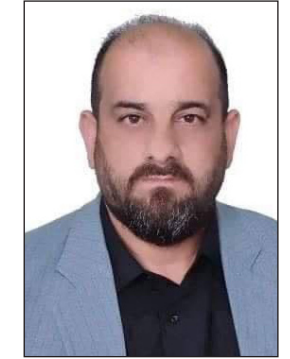
الكاتب / عباس عدنان مالية