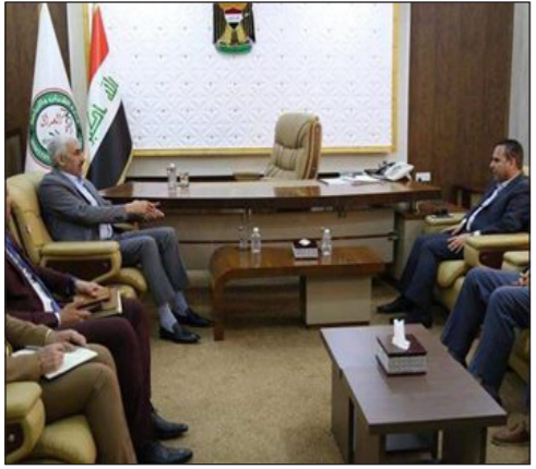
ناقش محافظ بابل حسن مندوب السرياوي مع وزير الشباب والرياضة د. أحمد العبيدي عددا من المواضيع التي تهدف للنهوض بالشباب ودعم هذه الشريحة والإستفادة من طاقاتها.