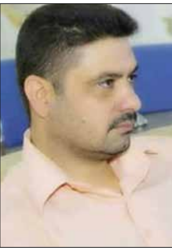
أعطيك نصف العمر واسمع مطلبتي أو كل ما عاد قلبي يطمع

خذ ما تشاء فقط أعد لي ساعة قبل الهوى والله فيها أقتنع