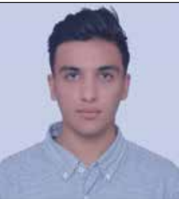
بقلم / علي آغا الزبياري

لماذا يا قلبي لقلبي لا تميل تلك الجميلة ليس لها نديل شغرها الملقى علي كتفها وعينها وقلبي كم هو جميل يسارها يداها خضرها فمها طولها كالليل الصيف الطويل صوتها حركاتها أنوثتها كبرياتها كالخيل الاصيل أحب أن أعشق كل شيء فيها حطفتها وأدميتها بالتحصيل اعترف انك دخلت قلبي لم يعشق أحداً ولا للنساء يميل عندما لا أرى عينك يوماً أظرفي تشيل ونمعي يسيل سأعطف بك بطني لك ولا أظن ولكن ماذا أفعل لقلبي البخل