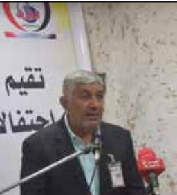
بقلم : محمد الحريايي

قالت له زوجته لا يوجد لدينا مواد غذائية ولا حتى ألف دينار ماذا أفعل؟ اجابها بصوت حزين غدا صباحا سيكون لدينا حسين نائما ساقوم ببيع زوج الحمام في سوق الجمعة وسأجلب بمبلغها موادا غذائية. جاء الصباح وخرج الأب إلى سوق الجمعة، يتحين للناظر أنه لم يبق الطعام منذ أربعة أيام، ما إن وقف في السوق ليعرض الحمامتين للبيع وصل رجال الشرطة واقتادوه إلى السيارة، قال بصوت حزين صوت فقير يشهد الله تركت عائلتي بلا أكل وليس لدي مصدر رزق، وهاتين الحمامتين لولدي جئت لأبيعهما لأشتري لهم موادا غذائية، لم يستمع الشرطة لما يقول وقال له اصعد لقد كسرت الحظ.