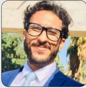
بقلم احمد كامل

عن المقهى مسافة ليست بقصيرة ، كانت تعصف بذهنه مشاهد السنين الماضية ، كان يشعر بالأسى على ما مضى من عمره دون أن يحقق فيه ما يريه ويسعى إليه ، كان منكسر القلب يأن من الحزن ، وكأنه أحس بمرارة الحياة لتوه ، دخل الى بيته وجلس على أريكة في حديثه الصغيرة ، وهو منشغل بالتفكير ، يعنصره الألم لهذا الحال المزري الذي ارتضاه الشباب لهم كإسلوب حياة .. فختمها بدمعتين جرتا على خديه المليئين بخطوط السنين وعذابها .