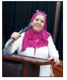
بقلم دنيا زاد بوراس

واقسمت أن اصوم على الرجال مادمت شعله من لهب فالصوم عبادة ولاجلك اصوم شوال و رمضان و رجب لا ابالي بتعب الجسد والمسكين وتهب ولا بلهب فالحب يمدني قوة يصنع العجب لاجلك الم ماتبقى من شظايا . من نهب لاجلك وحدك احببت الحب واقسمت أن اصوم انت يااسد الصحراء ياسيد القوم يامن تقدر الحب تعطف على المحتاج والمسكين وتهب هب لي قلبك فيه اسكن وفيه متعة روعي وفيه الهلب انا حيك في ليل بهيم اشواق والحنين وروح الغياب الامل اشتري حبي