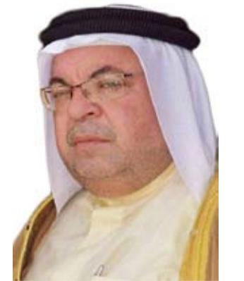
بقلم / ابراهيم الدشش

اتجاه بوصلتهم، وبما يخدم مصالحهم الشخصية، وبوسع المرء ان يستحضر الكثير من الحالات التي وجدنا فيها من لا ضمير لهم، او باعوه في سوق سوداء للتداول والتنافس والمنازع الخاصة وكيف تلبدت عندهم الاحاسيس وماتت المشاعر وانعدمت المبادئ، التي يتحدثون عنها وغدا عندهم المعروف منكراً، والحق باطلا، والوطنية ارقاما وحسابات، وانجازاتهم كحكايات مليئة باللصوصية ... والخلاصة اضعاف رصيد الأمل في كل شيء.