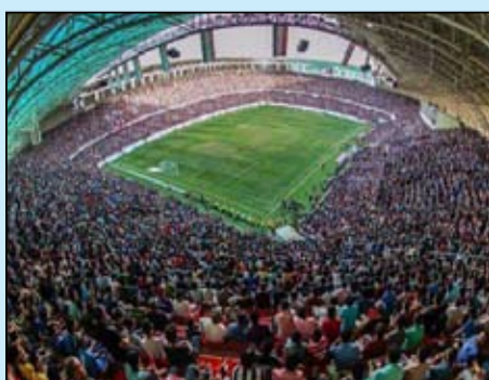
موعد لانطلاق الموسم الجديد لبطولة الدوري العراقي بسبب تداعيات انتشار الفيروس التاجي.

متابعة / علي الخفاجي قرر اتحاد الكرة العراقي، الأربعاء، إلغاء منافسات بطولة الدوري للموسم الحالي ٢٠١٩-٢٠٢٠ بعد فترة التوقف بسبب فيروس كورونا المستجد «كوفيد ١٩».. وجاء ذلك بعد اجتماع الهيئة التطبيقية مع ممثلي الأندية العراقية لحسم مصير المسابقة وجاء القرار بإلغاء الموسم بكافة نتائجه.