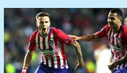
الاعلان بعد ثلاث أيام. وأعلن اللاعب اليوم الأربعاء عن إنه قام بتأسيس نادي جديد تحت اسم «كوستا سيتي» في مدينة إلتشي الإسبانية مسقط رأسه ويضم لاعبين ما بين ٤ إلى ١٨ عاما. وارتبط اسم ساؤول بالانتقال لصفوف مانشستر يونايتد خلال الفترة الماضية، بعدما لفت أنظار المدير الفني للشياطين الحمر أوليه جونار سولشارير. ويرتبط اللاعب صاحب الـ٢٥ عاما، بعقد مع ألتيكو مدريد حتى صيف ٢٠٢٦ ويملك شرط جزائي قيمته ١٥٠ مليون يورو.

متابعة / علي الخفاجي كشف الإسباني ساؤول نيجيز لاعب وسط ألتيكو مدريد على ناديهِ الجديد، بعدما أثار حالة من الجدل حول مستقبله في الأيام الماضية.