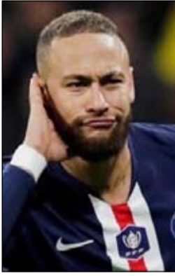
متابعة / علي فاضل جبار قدم ناشط في حقوق المثليين، شكوى لدى النيابة العامة في ساو باولو، بشأن رهاب المثلية،

ضد نجم كرة القدم البرازيلية نيمار، الذي وصف شريك والدته بهـ"الشاذ جنسياً". أكدت النيابة العامة لولتقيها الشكوى التي سيرسها النائب العام، ويقرر ما إذا كان سيقاضي مهاجم نادي باريس سان جرمان الفرنسي من عدمه. وكان الناشط أغريبينو مغالبايس، غير المعنى مباشرة بالقضية، أعلن الإثنين الماضي في حسابه على إنستغرام نيته تقديم شكوى حول "رهاب المثلية وخطاب الكراهية". ورفض المقربون من النجم البرازيلي التعليق على هذا الخبر.