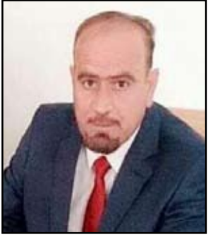
بقلم / ظافر قاسم آل نوفه

صباح الخير إن كان صباحاً ومساء الخير إن كان مساءً قد يتذكر هذه الكلمات شباب السبعينيات جيداً وتنعّم بها شباب الثمانينيات كثيراً وربما تتبع أواخرها شباب التسعينيات ، لأنها كانت بمثابة الشعار الموحد في جميع الرسائل وكثيراً ما إعلت رسائل الهوى والغرام وثورة بركان الشباب العاطفي . وعندولوج في كيفية وصول الرسائل الغرامية إلى العشاق فكان وجوب الاستعانة بمهارات ( رافت الهجان ) أو طلب نداء الاستغاثة بقدرات العنصر السري (جيمسي بوند) بسبب إعدام الاتصالات أو قد تكون نادرة ، وكثيراً ما تتداول الرسالة الواحدة لأكثر من يد والطامة الكبرى إذا ما أخطأت إحدى هذه الأيدي طريقها فان حرب ( البسوس ) سوف تشعل من جديد . أما العقود التي سبقته فقد تكفلت الأعين بتوصيل الرسائل معتمدة على نظرات سريعة وحجولة ولنا في ارتنا الكثير من الأمثلة ولعل أجملها ما تغنى بها مطربينا وهي أغنية ( فوك إننا جبل ) واختصرت ب( فوك النخل ) إذ النظرات وحدها هي التي أوصلت لنا هذه الأغنية الجميلة والكثير من القصائد الثرية . ( ولا عاد اليوم عندي صديق صاير جد الله يجرم ) وماخذ الموبايل عرض بطول وكلها مكالمات غرامية وعندما سألته عن الجدوى من هذه المكالمات وعن هذه العلاقة كمال : ما أدري هيج تماشياً مع التطور لا يا (بلخي) على هذه الدكة