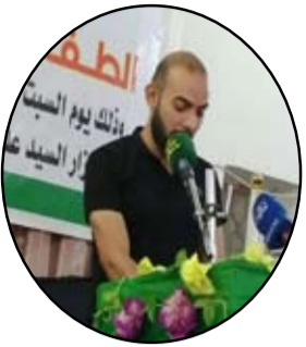
ذو الفقار علي الطرفاوي

دخل الحاكم الأعظم بجيشه الدموي أرضاً فيها خير من ماء ونفط ونبات وقال جررت هذه الأرض لنبال أهلها حريتهم في ظل الديمقراطية، فوضع الدستور برغبته عوناً لأصحاب الأرض لتخفيف العبء عليهم، وأصبح الرئيس ينتخب من قبل الناس فجلس على الكرسي الأنسب فاعترض الناس قال الحاكم لا هذه أولويات فهي روح الديمقراطية فتقبل الناس الأمر ببساطة وقالوا ياله من إنسان ديمقراطي نبيل، وبدأ النهاب في ملعبهم بالتصويت على الحكومة والوزراء، فوزير المالية حمال و وزير الداخلية نعسان و وزير الدفاع جبان والبقية ذو تبعية وأطماع وجميعهم برتبة لصر، فاخضت ثلث الموارد والبطالة تزداد فلا بناء ولا تقدم ولا أمن بفترة ستة عشر سنة، وقال الحاكم منذ مجيبي سآبني هذه الأرض وأجعلها أجمل أرض في الكون، فاعترض الناس ضد الحكومة والنهب وبيات المعترضون تحت نيران الشغب، فصرح الحاكم هذه حرية التعبير ضد الفساد فلا يجوز اقتلاع السلمية وسلب حقوق الناس، فقال المعترضون يا لك من ثعلب مكار لم يكن الدستور من تدبيرك و الرئيس عندك كان الأنسب فتبسم مرحجا وقال لست أنا بل هذا وسواس الشيطان أتوب إلى الله من هذا والآن معكم وجيوبه مقلقة بالأوراق الخضراء، فباسم الحرية احتل الأرض وقتل ونهب الأموال وبيات متخوماً والناس تناطح كالأغنام بحلبة الحرية متناسين أن الثعلب يحكمهما دون صافرة إنهاء ليشبع نهبها حتى آخر نفس.