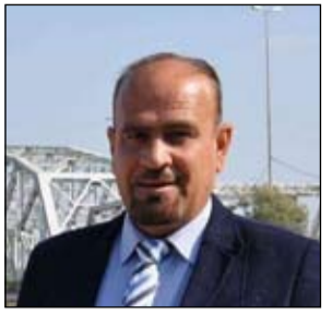
بقلم / ظافر قاسم آل نوفه

أثناء سيرنا لموعداً ما أجبرنا مرغمين على التوقف لفض نزاع طفلين من أبناء (محلة) واحدة بمعنى أنهم جيران كانوا متشابكين يضرب احدهما الآخر بلكمات و (راشديات) مطعمة باشهى أنواع السب والشتم ، وبعد تفريقهم وكلا منهما ذهب إلى بيته ظننا بان (العركة) فضت وانتهى حالها ، تفاجئنا بعد لحظات بان المعركة سرعت من جديد بين كبار العائلة وبدأت تأخذ طابعاً آخر بين العائليتين وبدأ الوعيد والتهديد يصل إلى أعلى مستوياته .