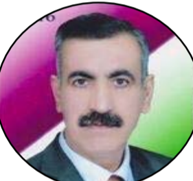
بقلم / صلاح النعيمي

ترك رجل زوجته وأولاده من أجل وطنه قاصداً أرض معركة تدور رحاها على أطراف البلاد... وبعد انتهاء الحرب وأثناء طريق العودة أخبر الرجل بأن زوجته مرضت بالجدري في غيابه فتشوه وجهها كثيراً جراء ذلك.