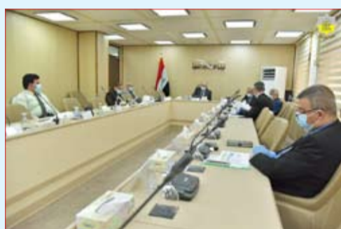
في حديثه إلى الدور الفاعل والريادي الذي اضطلع به ملاك المسوحات الزلزالية من خلال تكثيف النشاطات

عبر استعمال أحدث مستجدات تنفيذ الخطط والبرامج المطبقة به والعمل على قدم وساق من أجل الحفاظ على ملامح الإبداع في سجل الشركة. واختتم الاجتماع بجملة من التوصيات التي ترفع من مستوى النجاح في العمل والتعامل بإيجابية مع جميع المنتسبين والعاملين كونهم أهم مورد في العملية الإنتاجية.