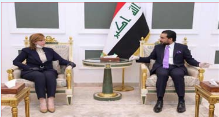
العراق الاخبارية / ريم اكرم ابراهيم

استقبل رئيس مجلس النواب محمد الحلبوسي وزيرة الهجرة والمهجرين إيفان فائق؛ لبحث سبل إنهاء أزمة النزوح، وذلك بالتزامن مع يوم اللاجئ العالمي.