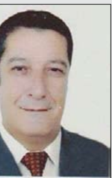
بقلم / يوسف الزنكاني

مسؤولية الإسلام والمسلمين أذاك فكان رمزا للوفاء والتضحية. اليوم السيد الكاظمي احتل الموقع الاول في المسؤولية في البلاد ولاول مرة يسمع الشعب العراقي من مسؤول كلام تطيب له النفس بعد مرور ١٦ عاماً . والكلم يعلم ان تلك السنوات اعتبه كثيرا وذاق فيها ما ناق من ألم وحرمان وعدم راحة . ففي اول خطاب للسيد الكاظمي كرئيس للوزراء قال انا الشهيد الهى لانني سواجاه متابع في مسيرة اصلاح البلد تيمناً بالآية الكريمة التي تقول (الذين قال لهم الناس ان الناس قد جمعوا لكم فاخشوهم فزادهم إيمانا وقالوا حسبي الله ونعم الوكيل) الآية ١٧٢ آل عمران . وساخسر العديد من الزملاء في الوسط السياسي مع هذا انما مصر على اصلاح الوضع المالي والاداري فاطلقت على نفسي بالشهيد الهى هذا يعني ان كل لحظة تمر عليه يكون مشروع جاهز للشهادة وقلنا ان الشهادة هي اعل درجات الفداء . فقال الكاظمي الشعب العراقي شعب حي يستاهل منا التضحية لانه لإيزال متعب من غبار السنين الماضية. فانا اليوم امامكم والكلام للسيد الكاظمي خادمكم الاول جئت من اجلكم مع انني لم احلم بالنتصب بل وضع الشعب قادي لهذه المهمة لذلك اقولها مرارا وتكرارا : أنا الشهيد الهى ومن الله نستمد العون