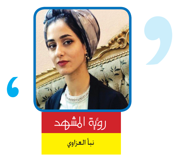
روية المشهد نبا العزاوي