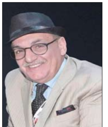
بقلم / الكاتب مازن جميل المناف

عند قراءتي للنصوص الشعرية ( لهات الأسيئلة ) توغلت في اغوار معاني الحروف لآظهار الصور البيانية المخبية بين المفردات والجمال عندما لامست شغاف القلب وحركت الوجدان وغازلت الخواطر وكشفت المفهوم الحقيقي لرسائل تنوعت مرماها واغراضها واتخذت اشكال مختلفة مستخرجا منها جواهر ونفائيس والمعاني قدمها الشاعر كوجبة دسمة وهو يرتدي الصبح معاطف ويلعن رحلة الحرف في اجمل احتدام ويوقظ صحوه البكاء تحت هاجس مقفل يندلع كمعزوفة حزن في زقاقه المحاصر ويناعم اصابعه اللعوب ) هذا بعض مما لفت انتباهي ونحن امام نصوص نظرية بامتياز بدءا من