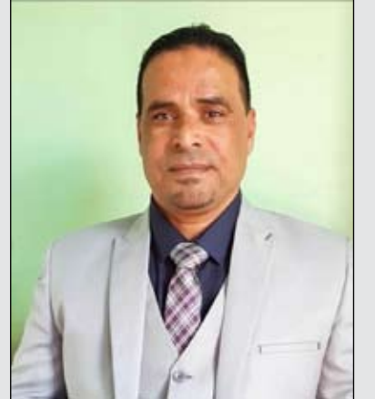
بقلم الكاتب/ احمد عزيز الدين احمد

لو نظرنا إلى واقع العالم العربي و الإسلامي سوف نشاهد رأى العين أن هذين الجيشين هم أقوى جيوش المنطقة و أقوى جيوش العرب و المسلمين، فان قامت بينهم حرب ولو بسيطة من خلال المليشيات و المرتزقة التي تزج بها تركيا حالياً في ليبيا ربما قلب هذا الصراع إلى تدخل الجيشين النظاميين للحرب في ليبيا و لربما امتدت إلى منطقة شرق المتوسط، وهذه الحرب لا يعلم مداها إلا الله ناهيك عن