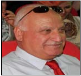
بقلم / كريم الزبيدي