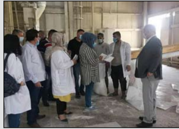
الحبوب للاتفاق على آليات جديدة تؤمن الفحوصات المختبرية، بما يسهم بإيصال النوعية الجيدة من الطحين إلى المواطنين ضمن مفردات البطاقة التموينية.

وأشار إلى، أن «المطاحن الثلاث تعتبر من أهم المطاحن الحكومية في بغداد ، و تغطي نصف إنتاج الطحين في العاصمة بغداد وتنتج كميات كبيرة يتم تزويدها للوكلاء وصولا إلى المواطنين» . وأوضح البيان، بان «دائرة الرقابة التجارية في جميع المحافظات نفذت جولات وزيارات تفقدية لعمل المطاحن والوكلاء للاطلاع على الطحين المجهز للمواطنين وأجراء الخبازة في جميع المواقع التي تم زيارتها وأظهرت نتائج الخبازة