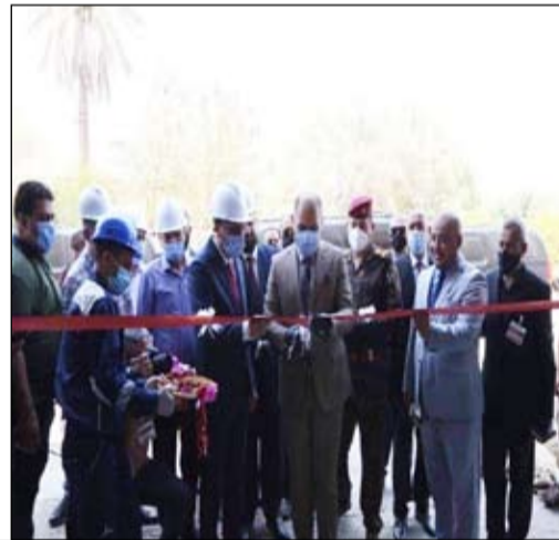
الخطوط ستنتج أنابيب بلاستيكية بأقطار كبيرة تصل إلى (١٢٠٠) ملمتر لأول مرة في البلاد لرفد وزارات الإعمار والإسكان والموارد المائية وأمانة بغداد وإيقاف استيرادها من الخارج.

الوزير باعداد خطط قصيرة ومتوسطة وطويلة الأمد لتأهيل وتنفيذ المشاريع الصناعية فقد كتفت الشركة جهودها وقامت بتعزيز معامل الشركة بخطوط إنتاجية جديدة بتكنولوجيا حديثة ومن مناشي رصينة لتلبية متطلبات السوق المحلية من أنابيب البولي إثيلين بقياسات كبيرة لرفد أمانة بغداد والوزارات المعنية بهذا المنتج الوطني الذي يمتاز بجودته ومناصفته للمنتجات المستوردة ، مفصحا عن أن لدى الشركة معامل ومشاريع جديدة ستري النور قريبا سيكون لها الأثر الكبير على النهوض بواقع الشركة والدفع بعجلة الإنتاج فيها.