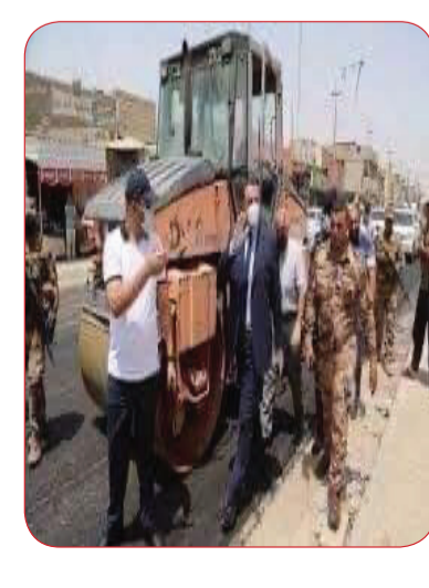
كركوك / علي ابراهيم حسن

تابع محافظ كركوك راكان سعيد الجبوري ، أعمال التأهيل والتطوير ، وتبليط الشوارع في حي الأسرى والمفقودين في القاطع البلدي الخامس في مدينة كركوك . ووجه المحافظ خلال تفقده الأعمال عدد من الملاحظات .. مثمناً جهود الفرق الفنية والهندسية والتخطيطية التي تعمل في تنفيذ ما وعدنا به مواطني محافظتنا .. قائلًا إننا عملنا وبذلنا جهوداً في تأمين الموازنة وإعدادها وتنفيذها فلن نسمح بتنفيذ أعمال مخالفة للضوابط لأن أولويتنا هي المواطن وخدمته ، وها نحن وضمن واجباتنا بساعات الظهر اللامب نشرف ونتابع المشاريع .