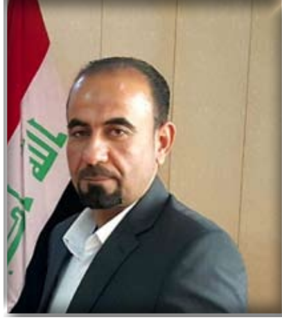
متابعة / حيدر كامل الأسدي

إن كان دين محمد لم يستقم إلا بقتلي فيا سيوف خذيني). وفي العاشر من محرم الحرام أهدرت هذه النفوس الأبية الطاهرة في سبيل إحقاق الحق وإزهاق الباطل والأمر بالمعروف والنهي عن المنكر في زمن استهترت فيه السلطة وداست على كل القيم الأخلاقية والدينية والإنسانية. وفي اليوم الثالث عشر منه ( ثالث الإمام