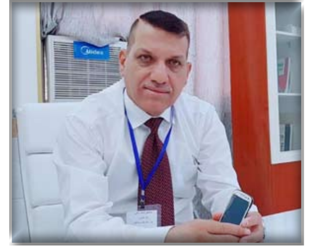
بقلم / بكر الشيخ ضاري

للتقافة دور كبير في بناء المجتمعات و اساس التعايش السلمي ، ومن الامور التي يجب ان تعكس حياتنا هي الثقافة المجتمعية والتي هي نظم معلومات سائدة في المجتمع والمكتسبة من عناصر متعددة كالعادات والتقاليد والدين . وتعتبر ثقافة المجتمع من اهم العلاقات الاجتماعية بين افراد المجتمع وان من اهم الثقافات هي الالتزام بمعايير المجتمع التي لا بد ان نلتزم بها في ضل جائحة كورونا هي الثقافة الصحية والتي نحن امس الحاجة لها في مجتمعنا من خلال الالتزام بما تم توجيهنا به وهو لبس الكمامة والتي تعتبر ثقافة صحية بحتة .