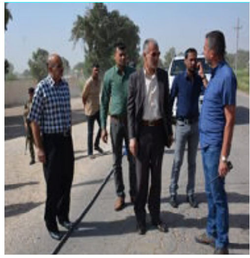
العراق الاخبارية / غانم جاسم

زار محافظ واسط مالك خلف الوادي منطقة الكارضية واطلع ميدانياً على سير الاعمال الجارية في اكساء الشارع الرئيسي بمادة الاسفلت كون الشارع حدي ويخدم اهالي المنطقة حيث اوغز الوادي الى ضرورة اكساء الشارع بمادة الاسفلت بالامكانات المتاحة ولكون البلد يمر بطرف أزمة مالية حادة لذلك وجه الوادي بضرورة الاستفادة من الامكانات المتواجدة والعمل الدؤوب من اجل النهوض بالواقع الخدمي لبناء المحافظة.