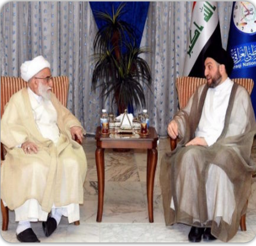
العراق الاخبارية / ضياء ياسر الاسدي

الثنائية بين العراق والجمهورية الإسلامية الإيرانية ، أكدنا على أهمية الوحدة والتلاحم بين أبناء شعبنا العراقي " . أشاد زعيم التحالف الوطني " بالدور الكبير للجمهورية الإسلامية في مكافحة الإرهاب ودعمها للعراق في مواجهة داعش ، أكدنا أيضا على ان العمل جار لمأسسة التحالف الوطني وتشكيل اللجان وعقد الهيئة العامة له " . مشددا " على ان قوة التحالف الوطني قوة للعملية السياسية باعتباره الكتلة الأكبر " .