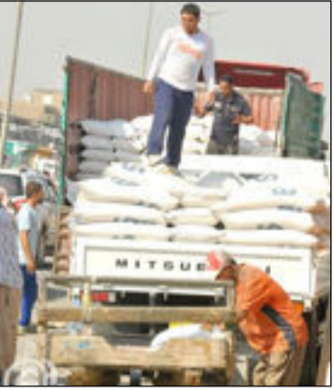
العراق الاخبارية / منى خضير عباس

وزير التجارة يوجه شركات الغذاء ارسال المفردات الغذائية العاجلة الى قضاء الشرافط