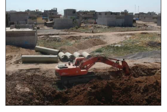
العراق الاخبارية / ريم اكرم ابراهيم

تتصاعد وتيرة حدة العمل في مشروع تنفيذ شبكات مياه المجاري في حي السماح ضمن مشروع تاهيل الشوارع الداخلية وشبكة تصريف مياه الامطار للقطاع الغربي من حي السماح بمدة عمل تصل الى ١٨٠ يوم، والممول من صندوق البنك الدولي وتنفيذ شركتي نفحات دجلة وشمس الهمام للمقاولات العامة.