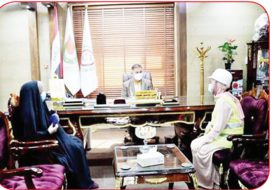
العمارة / علي عبد الواحد

رغم التحديات الاقتصادية المتمثلة بانخفاض اسعار النفط العالمية وتداعيات قرارات منظمة الدول المصدرة للنفط (اوبك OPEC) ، وعدم اقرار الموازنة الاتحادية وتفشي جائحة كورونا وتداعياتها . تبذل شركة نفط ميسان جهوداً حثيثة كبيرة وعلى الاصعدة والمستويات كافة لتوفير وأيجاد فرص العمل المتكافئة والسعي لتشغيل أبناء محافظة ميسان الحبيبة