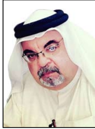
بقلم / ابراهيم الدهش

الدول في العالم أجمع ومن خلالها يمكن استقرار العالم واستتباب الأمن ، فمتى ما تمتع البلد بسلامة مهنيين وأصحاب كفاءة ونزاهة نجد ذلك البلد أكثر استقراراً وهيبه ، لغوياً هو مصطلح مأخوذ من الفعل المضارع يسيس أي يعالج الأمور ، أو من الفعل الماضي ساس أي سَيرَ ورتب و نظم شُؤون أمر ما ، اما اصطلاحاً فيعرف بمفهومها العام على أنها مجموعة الإجراءات والطرق والإساليب الخاصة باتخاذ القرارات من أجل تنظيم الحياة في شتى المجتمعات البشرية ، بحيث تنهج اليات خلق التوافق بين كافة التوجهات سواء على الصعيد الاقتصادي او الإنساني او الديني ، وحتى الاجتماعي ، إضافة إلى وضع خطة وآلية لتوزيع الموارد ، والقوى والنفوذ الخاصة في ذلك البلد .. إضافة إلى ذلك فإن سياسات الدولة تختلف بين وأحدة وأخرى حسب الأنظمة الحاكمة وما ترتب في دستورها ونظامها الداخلي وطبيعة الحكم فيها ومدى تطبيق مبادئ الديمقراطية فيها .