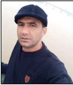
بقلم / ذوالفقار عبد الحسين

الكاتب عندما يمسك ريشته السحرية يخلق عالماً مليئاً بالخيال والحب لكن في بعض الاحيان يكتب عن شيء من واقعنا المرير الذي نعيشه . بالاخص ان كتبنا عن موضوع يخص الحياة اليومية او ما مررنا به في أحد الأيام او كان سابق عشناه او شيء ترك اثرا . طيلة تلك السنوات الماضية . اليوم بودي أن اكتب عن السجناء الراهبين الذين يملئون السجون العراقية ومنهم قد صدر بهم حكم الاعدام من اصحاب الجرائم الكبيرة . لكن إلى يومنا هذا