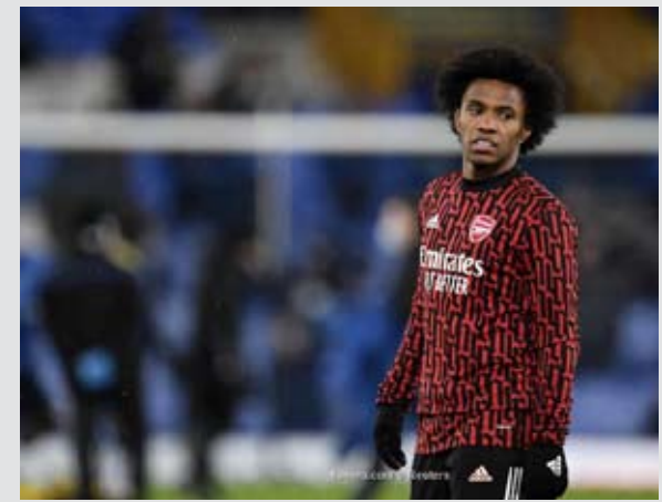
وكالات / العراق الاخبارية

أوضح نادي أرسنال أسباب غياب ٣ من نجوم الفريق عن المباراة الجارية ضد تشيلسي على ملعب الإمارات، ضمن منافسات الجولة ١٥ من الدوري الإنجليزي الممتاز. وخلص قائمة المدفعية من الثلاثي البرازيلي جابرييل، ديفيد لويز وويليان دا سيلفا. وكشف النادي اللندني في بيان عبر حسابه على موقع «تويتر» عن غياب جابرييل عن مباراة المديرية، بالإضافة للمواجهتين المقبلتين بسبب اتصاله الوثيق بأحد المصابين بفيروس كورونا، مما يفرض عليه دخول الحجر الصحي. كما أشار النادي إلى سلامة الثلاثي ديفيد لويز وويليان من فيروس كورونا، لكنهما يعانيان من المرض، مما تسبب في استبعادهما من القائمة.