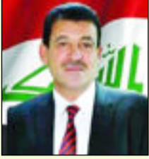
بقلم / عبد الرسول الأسدي

لعل من القضايا البارزة في مشهد الطف في كربلاء هي قضية الشهيد الحر بن يزيد الرياحي التميمي الذي حير العقول بما أقدم عليه من موقف لم يكن متاحا لغيره. لقد كان هذا البطل أحد أبرز قادة جيش عمر بن سعد وهو أول من قابل الإمام الحسين عليه السلام وهو في الطريق إلى الكوفة حيث كان منه ما كان من تصرف قاد الأمور إلى نهايتها المعروفة وهي مصرع الإمام وأهل بيته وانصاره فضلا عن مصرع الحر نفسه بين يدي الإمام (ع) بعد أن قاتل جيش ابن زياد بضراوة وبطولة استحققت ثناء الإمام عليه السلام حيث ذكر بعض الرواة بعض ما قاله ابو عبد الله في الحر وهو يوجد بنفسه ويلفظ انفاسه الأخيرة ومنها: ونعم الحر حر بني رياح صوبور عند مشتبك الرماح ونعم الحر إذا واصل حسينا وجاد بنفسه عند الصباح