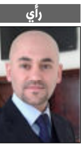
بقلم : أحمد الكبيسي

الواقع الخدمي فيها. واكد الوادي، بانه، تفقد حملة التأهيل التي تقوم بها الدوائر الخدمية في منطقة الخاجية الثانية، والمتضمنة