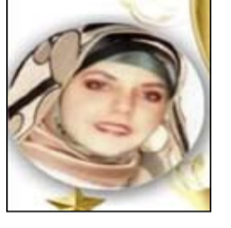
سفانة بنت ابن الشاطئ

المجد أشرق .. وأنتخت بغداد واجتاح نخل الرافدين عباد وتوضأت بالمسك قامة أمة تختال بين ضلوعها الأجداد وعلى نخوم العز أن عاشق في مقلتيه تكحلت أبعاد وضحا الرصاص .. وعرضت أشواقه حين امتطى خيل الدجى الجلائ وأغتل أنفاس الصباح مؤازرا يقوى الظلام .. وعزيد الأوغاد المجد أشرق .. والعراق على المدى للمجد نرب مقمر .. ومعاد من رافديه شقائق النعمان قد ظفرت بثمرتها .. وغيض سواد وعلى جموح خيوله أنداح السننا وتذخرت بتقائه الأجداد (الفتح) يزرع في المشارق نخله وعلى المغارب سغفه وقاد والنصر يضرب للنشامى موعدا وتوق شوقا إن نسا الميعاد المجد أشرق .. يا عراق المنطقي: (قل للجبان لغتنا الأصفاد) ..! (ذي قار) نادت .. والرخصة أوامات: (أرأيت أن جهنما بغداد) ..!؟