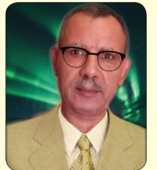
كتب د. محمد ضياح