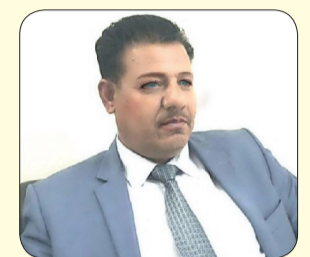
بقلم / كاظم حسين الزبيدي