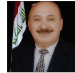
بقلم / م. ا. سعد القيسي

في كل فاجعة تحدث لهذا الشعب المظلوم من حرايق وتجزيرات ونكبات وسفك دماء وازهاق