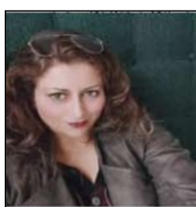
و في غمرة التمني والرجاء تنبثق خيوط نور من عمق الدجى

و كأن مشاعر المودة تتدفق سيولا من العطر العتق تسكبها نسايم الصفاء و تنثرها بسخاء ثم تتعالى الأصوات في الفضاء لتخترق سكون الوحشة الظلماء: أهازيج ساطعة الصدى و أحاديث جهورة النداء يخالطها رنين القهقهات