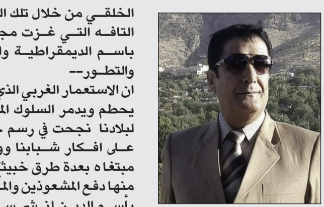
بقلم | يوسف الزنكنة

الخليقي من خلال تلك الثقافات النافذة التي غزت مجتمعاتنا باسم الديمقراطية والحرية والتطور-- ان الاستعمار الغربي الذي اراد ان يحطم ويدمر السلوك المجتمعي لبلادنا نجحت في رسم خارطته على افكار شبابنا ووصل الى مبتغاه بعدة طرق خبيثة وقذرة منها دفع المشعوذين والماجورين باسم الدين لنشر سمومهم القذرة المتخلطة بين الشعب الذي يجهل أغلبهم مفاهيم وأسس دينهم -- فنجحوا في تخدير عقول اغلب الناس وخاصة الفئة الشبابية من خلال فتاوى هناك طرق وافكار مسمومة تم من خلالها تسميم افكار وعقول الشباب باسم ثقافة التطور والتقدم والحرية الزليفة بعد ان قامت جهات استعمارية