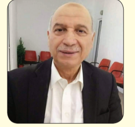
بقلمي - صلاح الورتاني

حدثني صاحبي فقال : جلست في مقهى وكان يعج بالزائرین وبإخوة عرب .. رحبت بأحدهم وجلسنا نتجادل في أوضاعنا إلى أن وصل بي السؤال : ما رأيك في أبناء بلدي تونس ؟ .. لا يحتاج إجابة .. أنتم أذكيا العرب فوالله حتى حميركم هي الأخرى ذكية.. كيف ذلك أخي ؟ .. في يوم من الأيام ركبت الحمار وذهبت للسوق اشترى خضرا وغللا وبعد إمتطائي لظهره سار بي الحمار في إتجاه غير الذي أمرته وكلما هممت بضربه نكس الحمار وأصر على وجهته ، فهمست إليه : ولقت : والله أن لم توصلني حتى عتية داري لأذبتك الليلة ، فما كان من الحمار إلا أن أوصلي لوجهتي أمام منزلي .. فقلت : والله حتى الحمار التونسي هو الآخر ذكي .. هنا دعوني أتوقف قليلا : صحيح أن شعبي ذكي ، نشكر زعيمنا الراحل الوفي .. لكن هل نحن الآن بعد الثورة اللعينة كذلك ؟ .. وإي يوم آخر لكم مني خالص التحية ..