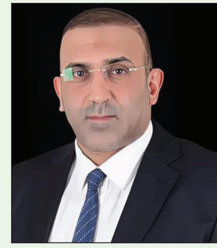
السيد يوسف الموسوي الأمين العام لحزب ثار الله الإسلامي

حدثني صاحبي فقال : جلست في مقهى وكان يعج بالزائرین وبإخوة عرب .. رحبت بأحدهم وجلسنا نتجادل في أوضاعنا إلى أن وصل بي السؤال : ما رأيك في أبناء بلدي تونس ؟ .. لا يحتاج إجابة .. أنتم أذكيا العرب فوالله حتى حميركم هي الأخرى ذكية.. كيف ذلك أخي ؟ .. في يوم من الأيام ركبت الحمار وذهبت للسوق اشترى خضرا وغللا وبعد إمتطائي لظهره سار بي الحمار في إتجاه غير الذي أمرته وكلما هممت بضربه نكس الحمار وأصر على وجهته ، فهمست إليه : ولقت : والله أن لم توصلني حتى عتية داري لأذبتك الليلة ، فما كان من الحمار إلا أن أوصلي لوجهتي أمام منزلي .. فقلت : والله حتى الحمار التونسي هو الآخر ذكي .. هنا دعوني أتوقف قليلا : صحيح أن شعبي ذكي ، نشكر زعيمنا الراحل الوفي .. لكن هل نحن الآن بعد الثورة اللعينة كذلك ؟ .. وإي يوم آخر لكم مني خالص التحية ..