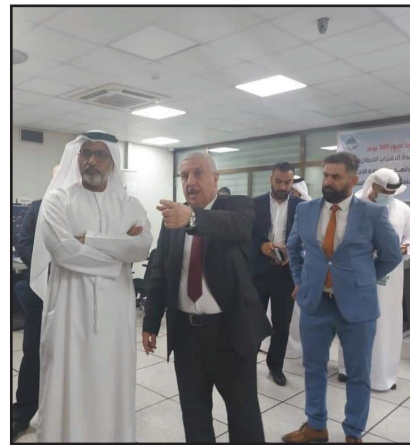
أمام سعادة الضيف والوفد المرافق له من خلال جولتهم في مركز المراقبة الجوية وبرج المراقبة

من جانبه قدم مدير عام سلطة الطيران المدني الإماراتي شكره وتقديره للإدارة العليا في الشركة على حفاوة الاستقبال معبراً عن سعادته لنجاح إدارة الشركة والعاملين من إدارة وتنظيم الحركة الجوية لكافة أنواع الطائرات بانسيابية وأمان دون أي استشارات أو خبرات أجنبية، وتم استعراض البرنامج التدريبي المعد من قبل سلطة الطيران المدني الإماراتي للدورات التخصصية والتنشيطية لتدريب ملاكات الشركة في مراكز التدريب الإماراتية ووفق المتطلبات الدولية.