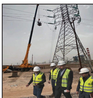
لاعلام الشركة: بجهود متميزة وعمل متفاني ومتواصل ليلا

ونهاراً وخلال شهر رمضان المبارك وعيد الفطر المبارك تمكنت ملاكتنا من إدخال الخط بالعمل لأول مرة والذي تكمن أهميته في زيادة الوثوقية والاستقرارية للمنظومة الكهربائية وتصريف أعمال محطة صلاح الدين الحرارية مع محطة ديزلات سامراء ومحطة شمال سامراء وبالتالي تغذية هذه المحطات لمحافظه صلاح الدين والاقضية والنواحي التابعة لها وزيادة ساعات التجهيز بالطاقة الكهربائية، خدمة لاهاليها الكرام.