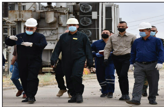
نينوى بالطاقة الكهربائية (٢) وذلك لربط التوصيلات من محطة خابات الثانوية (١٣٢ ك.ف) التي تغذي محافظة

يكون الربط لتحقيق توازن بالأحمال وتعزيز وتوثيق واستقرار المنظومة الكهربائية وتجهيز محافظة نينوى بالطاقة الكهربائية خدمة للمصالح العام.