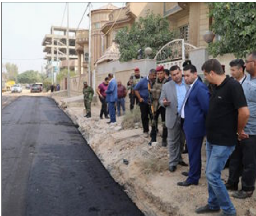
العراق الاخبارية / حيدر حسن هاشم

باشراف مباشر من محافظ بابل صادق السلطاني تم تبليط شارع الضريبة بجهود ذاتية من قبل مديرية بلدية الحلة وبدون شركة او مقاوله لتنفيذ المشروع بالإضافة الى جهود المعمل الحكومي المنتج لمادة