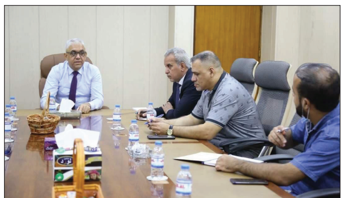
معاون مدير عام شركة نفط الوسط يتفقد عددا من الهيئات والأقسام في الشركة ويحث على الإسراع في تلقي اللقاحات لمنع تفشي وباء كورونا

- تنفيذاً لتوجيهات وزير الصناعة والمعادن السيد : منهل عزيز الخباز...ترأس مُستشار الوزارة لشؤون التنمية السيد : قبيصر أحمد عكله الهاشمي هذا اليوم الثلاثاء المصادف ١٠/٨/٢٠٢١ اجتماعاً مُوسعاً حضره عدد من السادة المسؤولين في المؤسسات الأمنية وعدد من المسؤولين في مقر الوزارة . وجرى خلال الاجتماع مُناقشة جُملة من المواضيع المهمة والملفات المتعلقة في بناء نظام