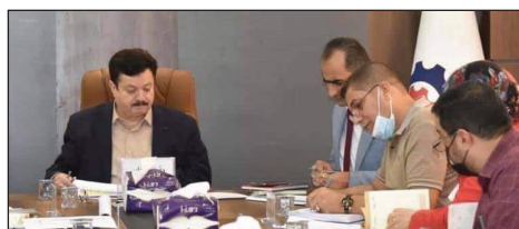
معاون مدير عام شركة نفط الوسط يتفقد عددا من الهيئات والأقسام في الشركة ويحث على الإسراع في تلقي اللقاحات لمنع تفشي وباء كورونا

من جانبه، أكد المدير العام على ضرورة العمل وبما ينسجم مع خطط الشركة المحددة، وفعالية التنسيق بينها وبين إدارة المعاوية للوقوف على القضايا كافة التي تخص العمل والعاملين، لغرض تحقيق الأداء الحقيقي والمرغوب للطراف جميعها، والذي يهدف إلى تحقيق أقصى طاقات إنتاجية ممكنة.