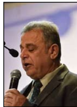
ليلة لا تحمّل اسماً ولا عنواناً في صحف المدينة

أعلنت الحزن على هروب الشمس قبل سويغات وأقداً الليل تدوس اسراب الغادين في رحلة نحو الشفق السماء هذه الليلة بلا ألوان كل شيء قاتم الآن النوم وهج النساء القابعات جنب مهود أطفالهن يتنحنن مع انين الريح