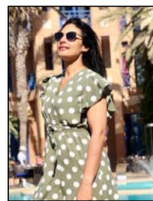
بقلم: بلقيس بابو

هواك قبلة الروح إلى أهد و مكة قبلة الدنيا و الدين تحمل عيناك