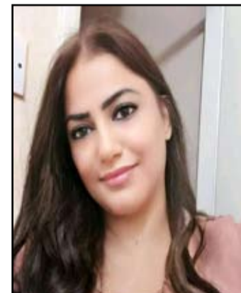
هل سمعتم أغاني الورد البيضاء

؟؟.. هي تلك السمفونية التي ارتكبتها على أوتار الندى ذات شوق .. فتربّع حرفي على كثيف الغمام وقبل الثرى الناهد .. قبلة .. على مدار السماء أبث النور في مساماتها حين ينافسني موشور الصباح في رسم وجهك على حدقات قلبي بالوان طيفه ... ناعس حلمي .. ما زال لصيق الوسادة ... نسيبت أن أوظفه أن أسل نبضه بصوتك