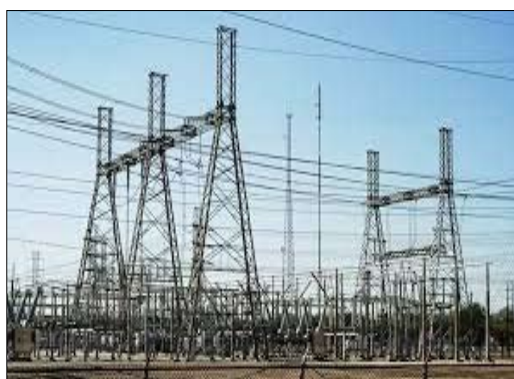
النفط لتعويض ما فقدته المنظومة من الغاز المورد حتى تحد من الخسائر المحتملة ، بالتزامن مع الاتصالات الدبلوماسية والرسائل

تستمر وزارة الكهرباء في تقديم جهودها واستنفار ملاكاتها للحفاظ على مستويات انتاج الطاقة ورفع ساعات التجهيز بما تسمح به إمكانيات شبكات النقل التوزيع المتاحة وآلياتها المستحدثة . في الوقت ذاته ، تستمر الأزمات الطارئة والمتكررة في بقرقلة انجازاتها من خلال تعرض المنظومة الوطنية اليوم الاربعاء الموافق ٨ من ايلول ٢٠٢١ لمشكلة انحصار اطلاقات الغاز الإيراني المورد لمحطات الإنتاج في المناطق الوسطى من (٢٠) مليون متر مكعب الى (١٢) مليون متر مكعب، توقفها بالكامل عن المناطق الجنوبية الامر الذي ادى الى تحديد احمال المنظومة الوطنية وخسارة قرابة ٥٠٠٠ ميغا واط من الطاقة ، لتتكرر نفس الازمة للمرة الثانية بعد مضي اسبوع واحد فقط من الانحصار السابق . من جانبنا وضمن اجراءات الوزارة لتلافي النقص الحاصل في كمية الوقود المشغل للمحطات ، اجريت الاتصالات العاجلة مع وزارة