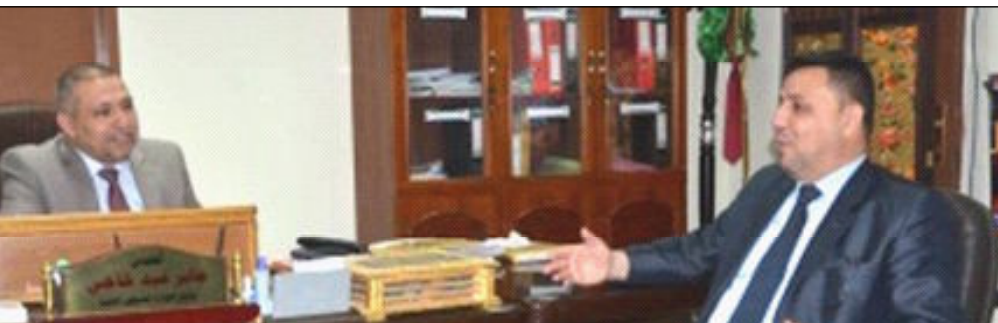
العراق الاخبارية / علياء فهد جواد

يتجه بخطى سريعة نحو توظيف التقنيات الحديثة في كل جزئيات العمل السياحي من اجل الاستثمار الأمثل لهذا القطاع الحيوي الذي يوفر فرص عمل ومردودات مالية ترفد خزينة الدولة. وتابع السيد الوكيل ان الوزارة على استعداد تام لتقديم كل الاسناد والدعم لهذا القطاع بقدر تعلق الامر باختصاصات الوزارة.