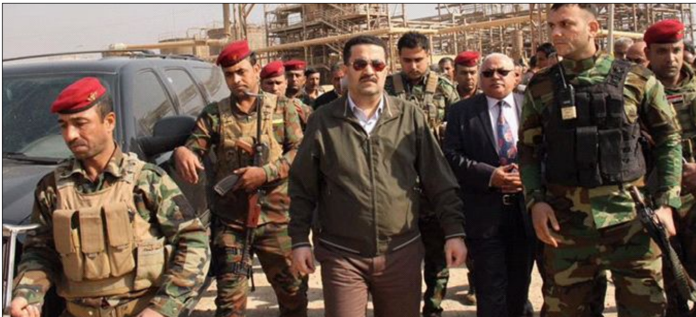
بغداد / العراق الاخبارية

زار وزير الصناعة والمعادن وكالة المهندس محمد شياع السوداني الشركة العامة لكبريت المشراق إحدى شركات وزارة الصناعة والمعادن الواقعة في قضاء الشرقاط التابع الى محافظة الموصل. وقال مدير مركز الاعلام والعلاقات العامة في مقر الوزارة عبد الواحد علوان حمود ان السيد الوزير وفي مبادرة هي الاولى قام بزيارة تفقدية