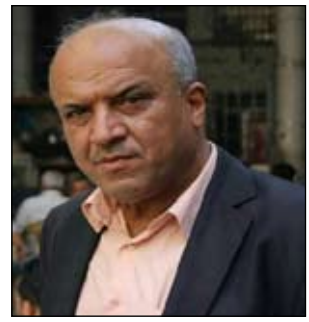
تحقيق / علي صحن عبد العزيز

تعد المؤسسات التربوية الركيزة الأولى من ركائز تنمية الشعور الوطني ابتداءً من الروضة وحتى المراحل الجامعية، وفعالية تحية العلم في يوم الخميس من كل أسبوع تساهم في تنمية حب الوطن والانتماء والتضحية من أجله، ولذا فعلى إدارات المدارس والجامعات وكافة المراحل الدراسية القيام بدورها البناء والحقيقي في تعميق حب العلم على أن يتجسد تلك المعاني في بناء العراق وأزدهاره، وتقدمه، على اعتبار أن الروضات والمدارس والجامعات مصنعا للجيل، والتي من شأنها بناء أجيال لكي يسهموا في مسيرة العطاء والمحافظة على منجزات الوطن ما يعمق ويقوي الانتماء لدى الطلبة.