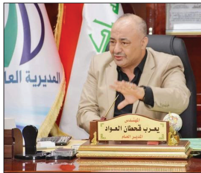
ليتم على بركة الله انجاز (مشروع شبكات الحر) ومشروع (محطة معالجة قضاء

(الحر) هذان المشروعان الاستراتيجيان واللذان يعدان صرحان خديمان قائمان في محافظة كربلاء من تخصصات المديرية العامة للمجاري احدى تشكيلات وزارة الاعمار والاسكان والبلديات العامة والمحال تنفيذه الى شركات وطنية. حيث تسهم هذه المشاريع في تحسين الواقع الخدمي والبيئي وزيادة الحصاة المائية من خلال توفير مياه صالحة للسقي الزراعي وبطاقة تصميمية ٣/١٧٠٠٠٠م/باليوم وتقليل اثر التلوث البيئي وتحسين الواقع الخدمي بالاضافة الى انتاج الاسمدة العضوية ودور المشروع في خلق فرص عمل للطاقات الشبابية من ابناء المحافظة . يذكر ان المديرية العامة للمجاري على ابواب قطف ثمار عدة مشاريع اخرى انشالله بعد ان حققت هذه المشاريع نسب انجاز متقدمة واعادة استئناف الاعمال في مشاريع اخرى بعد ان كانت متوقفة لعدة سنوات وتسريع عجلة العمل في المشاريع المتلثة نتيجة الجهود الحثيثة المبذولة من قبل المهندس (يعرب قحطان العواد) مدير عام المديرية والمخلصين بمعنته من منتسبي المديرية .