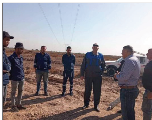
موجهاً بتبذيل أي . وتأتي هذه الزيارة صعوبات قد تواجه العمل ضمن سلسلة من الجولات

الميدانية التي يجريها المدير العام لغرض الإشراف والمتابعة على نسب الإنجاز التي يجريها المدير العام لغرض الإشراف والمتابعة على نسب الإنجاز المتحققة والاحتياجات اللازمة التي تحتاجها الملاكات لإنجاز العمل ، لرفد الشبكة الوطنية بالطاقة الكهربائية ، في سبيل تحقيق أعلى مستويات الخدمة للمواطنين . مشيداً لشعبنا العزيز .