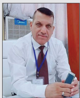
بقلم / بكر الشيخ ضاري

يحتفل العراقيون في الخامس عشر من شهر نيسان سنويًا بيوم الفلاح العراقي او ما يسمى بعيد الكادحين حيث عقد اول مؤتمر للمجمعات الفلاحية العراقية في الخامس عشر من شهر نيسان عام (١٩٩٥) ، حيث أن هذا اليوم و هذا التاريخ يعكس الاهتمام بالفلاحين العراقيين و ما يقدمونه من جهد كبير للإنتاج الوطني . و هنا لا بد أن نذكر أن للفلاحين طلبات و عوامل أساسية من أجل نجاح مهمتهم الوطنية و من أهمها هي توفر الحماية للمنتوج الوطني و أعادت النظر في المبادرة الزراعية و وقف تصحر الأراضي و تقديم كل الدعم و الإسناد لهم من خلال توفر الاسمدة و البذور و كذلك تفعيل المصرف الزراعي .