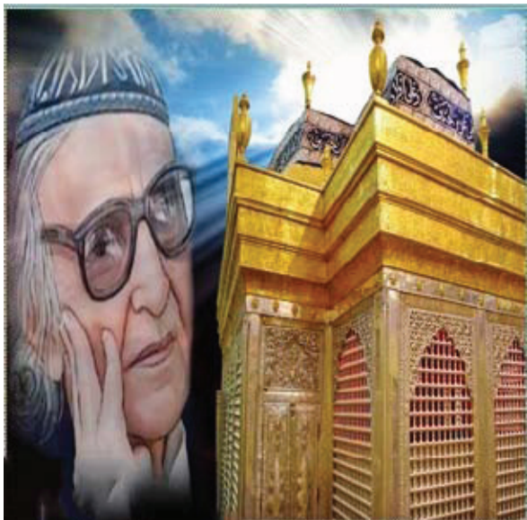
محمد مهدي الجواهري