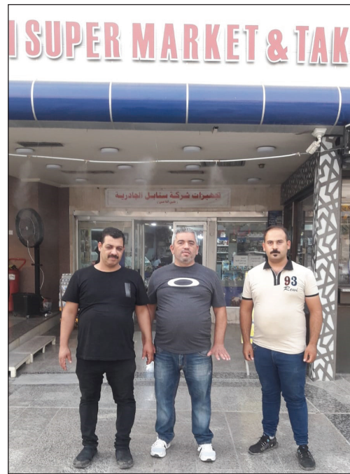
حوار بان رافد

استعداد تام لتجهيز الطلبات لكافة المناسبات علما ان منتجاتنا لحم عراقي خالص 100%