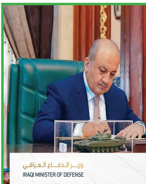
وزير الدفاع العراقي IRAQI MINISTER OF DEFENSE