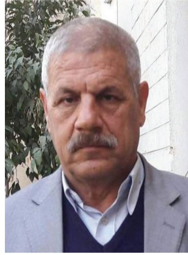
بقلم / كمال جاسم العزاوي الموصلي

يؤدي الى ترسيخ المفاهيم والممارسات الخاطئة والخطرفة في صيف رمضاني من ااصيف القرن الماضي وفي أحد الأسواق المكتضة بالمارة والصائمين جلس على جانب الطريق شاب يافع بملابس رثة يعمل عتالاً وقد بدت عليه علامات البؤس والفاقة .. أخرج من جيبه المهترئ لفافة خبز بداخلها شيء مما يؤكل وهم بقضهها فاذا بأحدهم يضغط على عاتقه !! رفع الصبي نظره للأعلى ليجد أمامه شرطياً يحمل هراوة وهو يصرخ بوجهه (أنهض يا حيوان وسر أمامي الى المخفر) زعر الصبي الفقير من هذا الكائن الغليظ الخلق وأخذ بالبكاء والتوسل به ليخلي سبيله لكن دون جدوى - أرجوك يا سيدي اتركني فوالدتي تنتظرني وستقلق كثيراً لتأخر عودتي - أغلق فمك ولا تجادل فأنت متهم بافطارك العلني في نهار رمضان - والله ياسيدي أنا أحمل البضائع وأنقلها للناس لأعيل والدتي واخواني