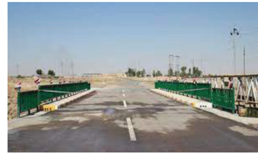
العراق الاخبارية / علي ابراهيم حسن

افتتح محافظ كركوك راكان سعيد الجبوري، الجسر الرابط بين قضاء الدبس وباي حسن بإشراف مديرية طرق وجسور كركوك. وأكد الجبوري بحضور ممثل قائممقامية القضاء وليد الحمداني وعدد من المسؤولين الأمنيين والوجهاء، أن الجسر سيسهم بخدمة مواطني القضاء وتسهيل حركة انتقالهم ودعم جهود الاستقرار. مشدداً أن الجسر نفذ ضمن خطط ومشاريع المحافظة ويأتي ضمن المشاريع التي يشدها القضاء ضمن خطط ومشاريع المحافظة لدعم مواطني القضاء..