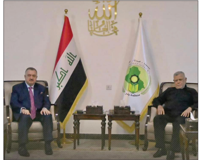
استقبل الأمين العام لمنظمة بدر السيد هادي العامري وكيل وزارة الخارجية للشؤون متعددة الأطراف والشؤون القانونية السيد عمر البرزنجي، في مكتبه ببغداد في يوم