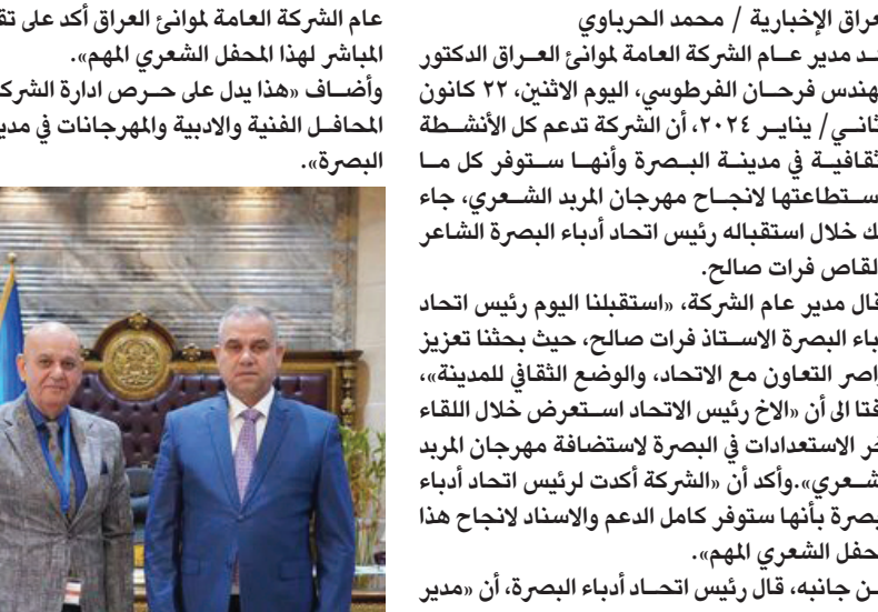
عالم الشركة العامة الموائى العراق أكد على تقديم دعمه المباشر لهذا المحفل الشعري المهم.