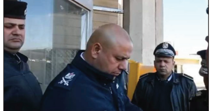
بغداد / كاظم حسين

من اجل الوقوف على احتياجاتهم ومتابعة طلباتهم يستمر السيد مدير مرور بغداد الكرخ اللواء (صباح عبد الحसन الربيعي) باستقبال المواطنين في مقر المديرية حيث وجه سيادته بالاهتمام بانجاز معاملات المواطنين والاهتمام بذوي الاحتياجات الخاصة وكبار السن وعوائل الشهداء والجرحى مؤكداً بأن أبواب مديرية مرور بغداد الكرخ ستبقى منترعة امام الجميع من اجل استقبالهم والوقوف على احتياجاتهم وطلباتهم وحل مشاكلهم وفق الصلاحيات والقانون مع ابداء المساعدة للحالات الإنسانية.