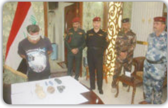
العراق الاخبارية / جاسم الحجامي

سيطرة درع الجنوب تلقي القبض على مهرب آثار وبحوزته ٧ قطع أثرية يحمل مستمسكات مزورة