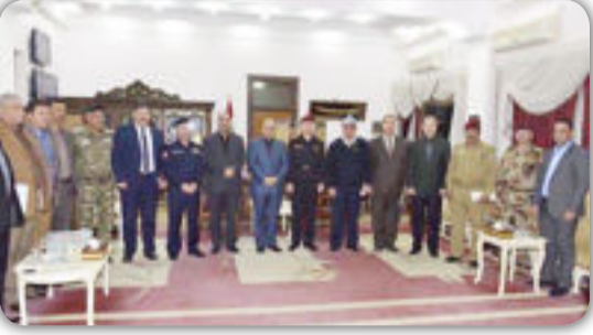
الديوانية / العراق الاخبارية

محافظة الديوانية يشهد بالدور الكبير للقوات الامنية وجهودهم الكبيره لتأمين مراسم الزيارة الاربعينية